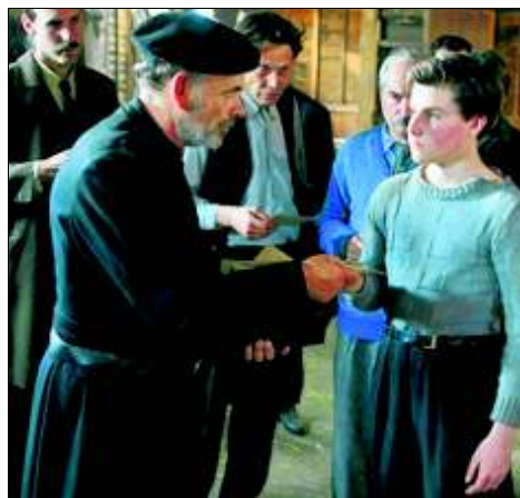
Szene aus dem Film „La mer à l'aube“ von Volker Schlöndorff

In Volker Schlöndorffs „Das Meer am Morgen“ wird Ernst Jünger zu einer Filmfigur – Eine Diskussion über den Autor in Marbach